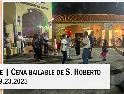
S. ROBERTO DINNER DANCE | CENA BAILABLE DE S. ROBERTO 09.23.2023

On October 4th the mission of San Francisco y Santa Clara celebrated their patron with a mass and blessing of animals. We thank the community for all their hard work in the preparations of their feast, as well as all who participated in the celebration. El 4 de octubre, la misión de San Francisco y Santa Clara celebró a su patrón con una misa y bendición de animales. Agradecemos a la comunidad por todo su arduo trabajo en la preparación de su fiesta, así como a todos los que participaron en la celebración.