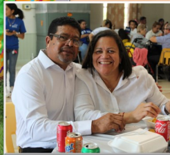
KERMESSE | FOOD FESTIVAL 10.08.2023

On Sunday, October 8th, the Nicaraguan community hosted their first Food Festival in the Mother Church, as a way to celebrate Hispanic Heritage Month and fundraise for the Nicaraguan Booth for the festival. We thank all who participated in cooking, donating, helping, and collaborating in the possibility of the event being a success. El domingo 8 de octubre, la comunidad nicaragüense organizó su primer Festival de Comida en la Iglesia Matriz, como una forma de celebrar el Mes de la Herencia Hispana y recaudar fondos para el stand nicaragüense del festival. Agradecemos a todos los que participaron cocinando, donando, ayudando y colaborando en la posibilidad de que el evento fuese un éxito.