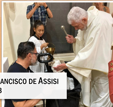
ST. FRANCIS OF ASSIS | S. FRANCISCO DE ASSISI 10.04.2023