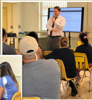
IMMIGRATION CLINIC | CLINICA DE INMIGRACION 08.06.2023

In the month of September we were able to open our doors and welcome Catholic Legal Services and volunteers from the Teresian Institute to help our community with their questions and concerns in regards to immigration. We ask for prayers for our brothers and sisters that are in need of legal services and all those that are willing to give them aid, may they have the time and willingness to continue serving them.