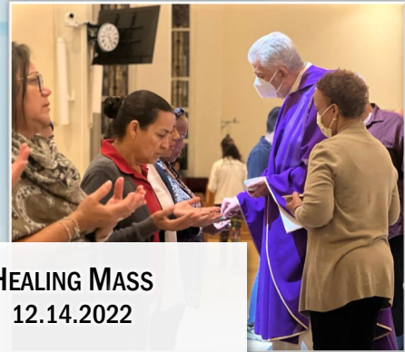
HEALING MASS 12.14.2022