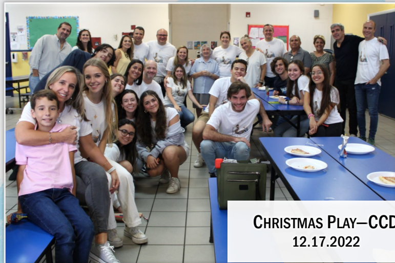
CHRISTMAS PLAY—CCD 12.17.2022