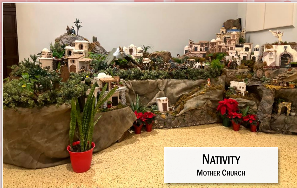
NATIVITY MOTHER CHURCH